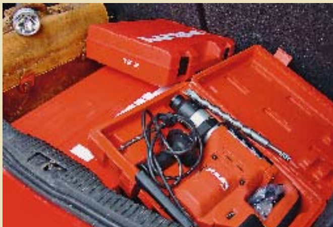
■ Die Fälschung.