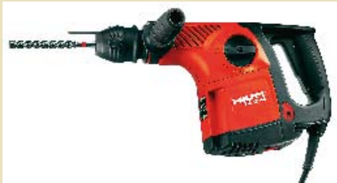
■ Das Original.