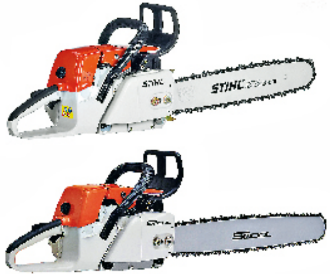
■ Die Motorsäge „MS 380“ stammt im Original (oben) von Andreas Stihl AG & Co. KG, das Plagiat von Swool Power Machinery Co. Ltd. aus China. Im Jahr 2006 erhielt der Fälscher eine Plagiarius-Auszeichnung.

das mit einer deutschen Marke aus dem Ausland importiert wird, mit hoher Wahrscheinlichkeit ein Plagiat. In solchen Fällen hilft eine Rückfrage beim Hersteller, um ganz sicher zu gehen.