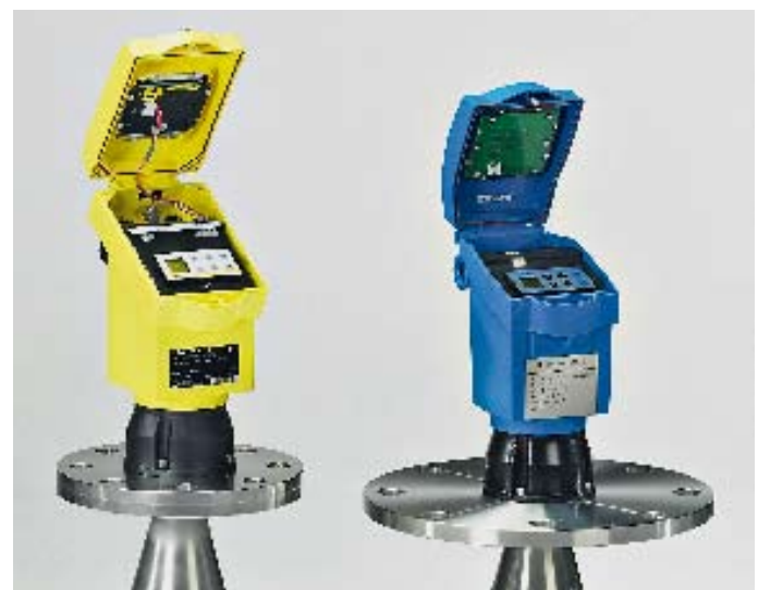
■ 2. Platz beim Plagiarius 2005: Füllstandsmessgerät „VEGAPULS 51-54“, Original (links) von VEGA Grieshaber KG. Das Plagiat stammt von Beijing Ripeness Sanyuan Instrumentation Co. Ltd. aus China.

Holland-Letz: Die überwiegende Mehrzahl der Produkte unserer Mitglieder wird nach wie vor in Deutschland produziert. Anders als z. B. in der Textil- oder Sportartikelbranche ist daher ein Werkzeug,